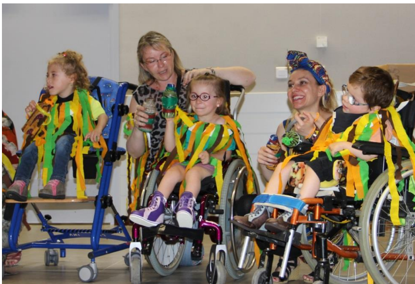
Fête de Chanteloup 2014

Des dons aussi, mais c'est vraiment peu fréquent.