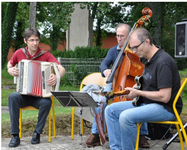
Concert La Belle Equipe , Fête de la musique organisée par la coopé, 21 juin 2016