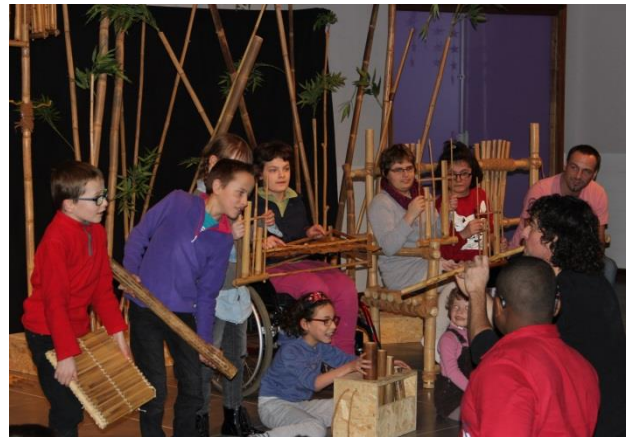
Petit banc au bout – Noël 2015