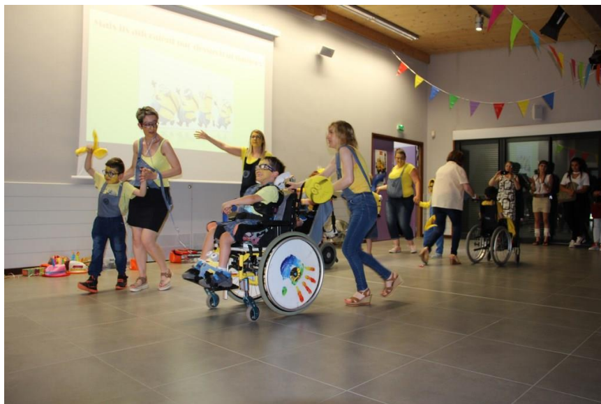
Fête de Chanteloup 2018