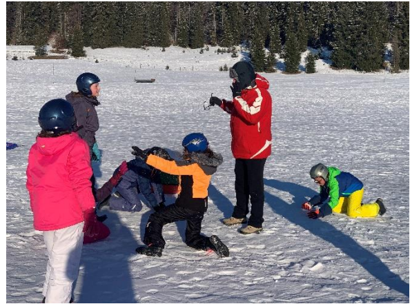
Classe de neige dans le Jura pour des jeunes sourds de la classes externalisée avec la classe de CM2 de l'école Guinguin en janvier 2020

La coopérative peut également être l'association support qui gère complètement le budget d'événements exceptionnels, tels le projet Danse avec les roues en 2008 ou le Centenaire de l'hôpital des Dames écossaises en 2015 →